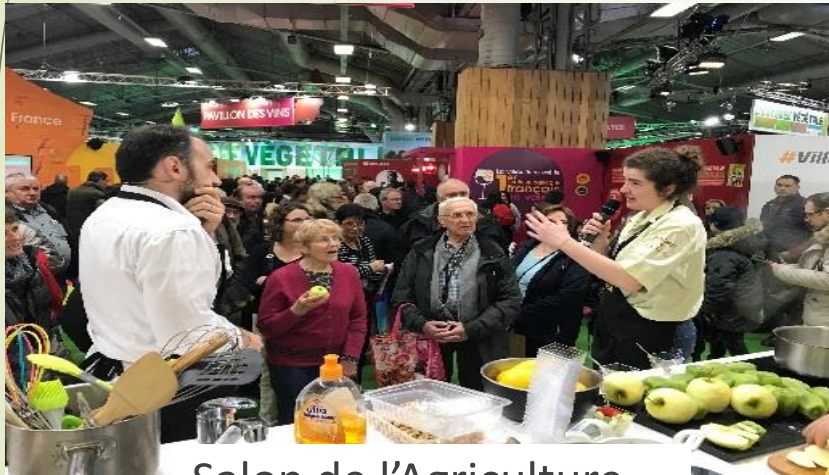
Salon de l'Agriculture